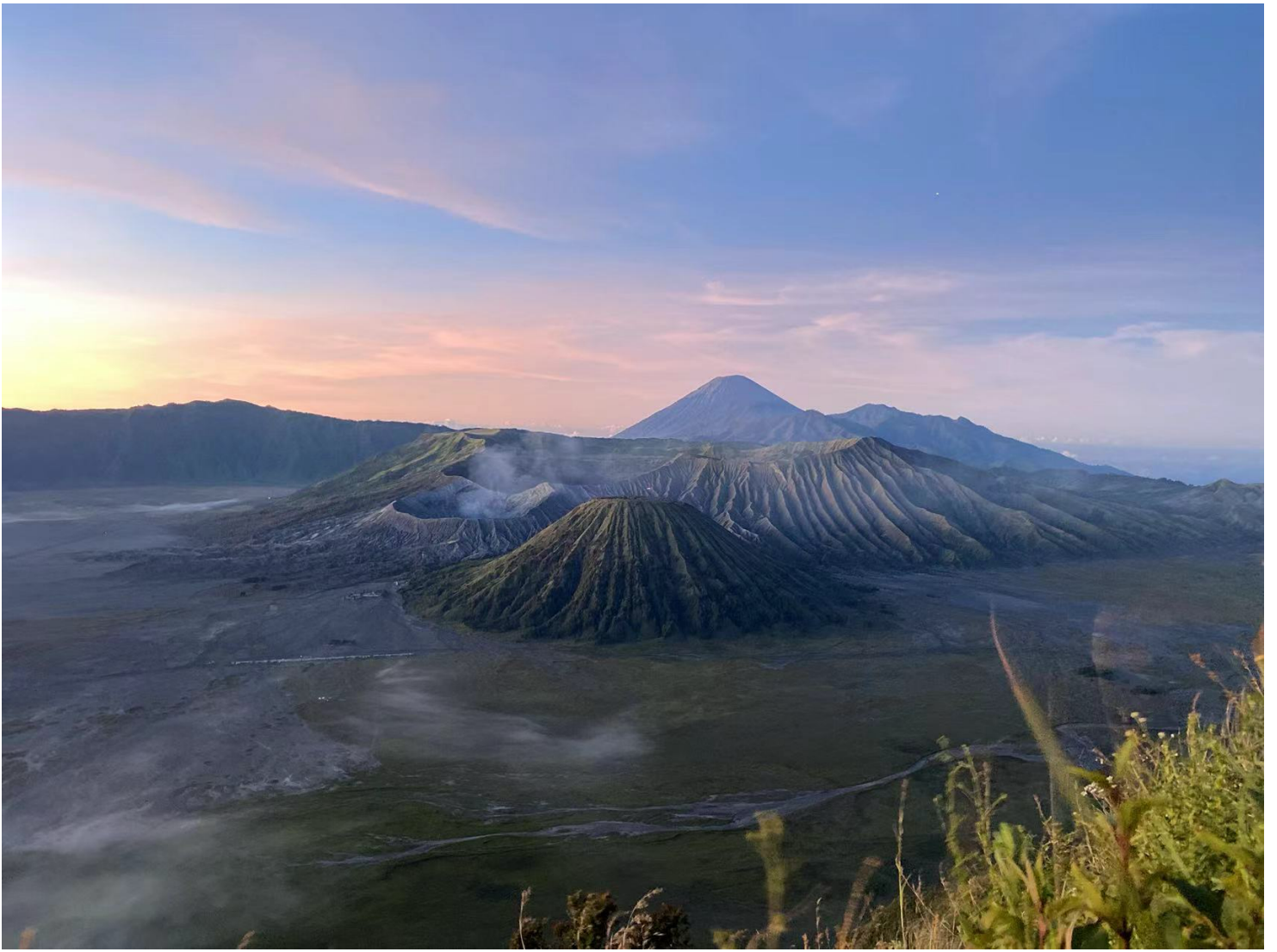
日出时分的光线直照在火山上，尤为壮美，所以需要夜爬