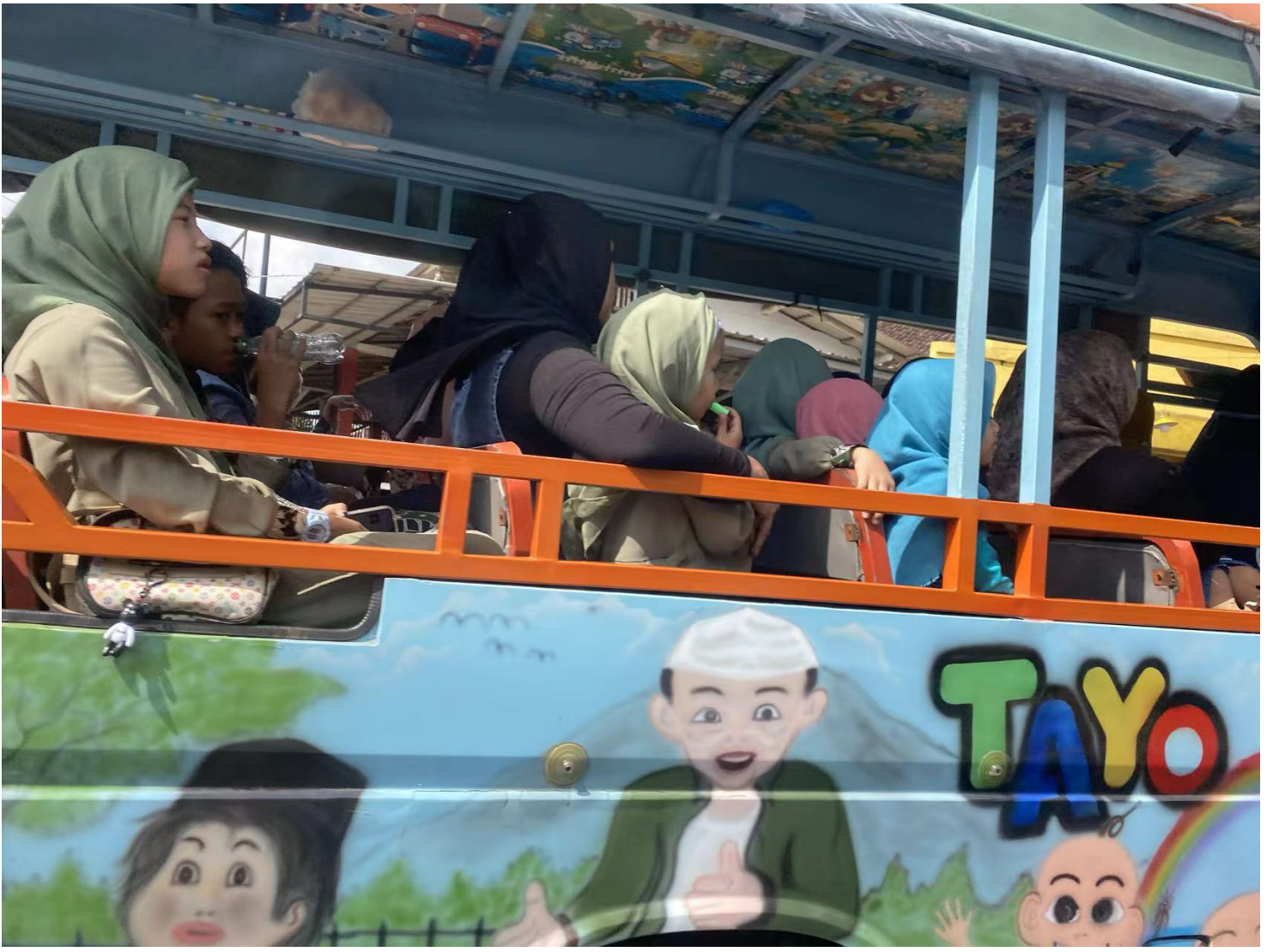
车辆非常喜欢涂鸦和贴纸，风格卡通。