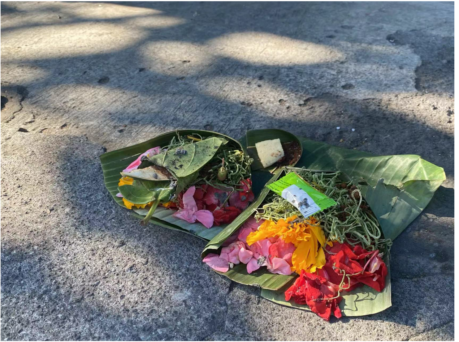
在巴厘岛，常见置于门口的祭祀用品，叶子做成的盘子，里面放置鲜花和食物。