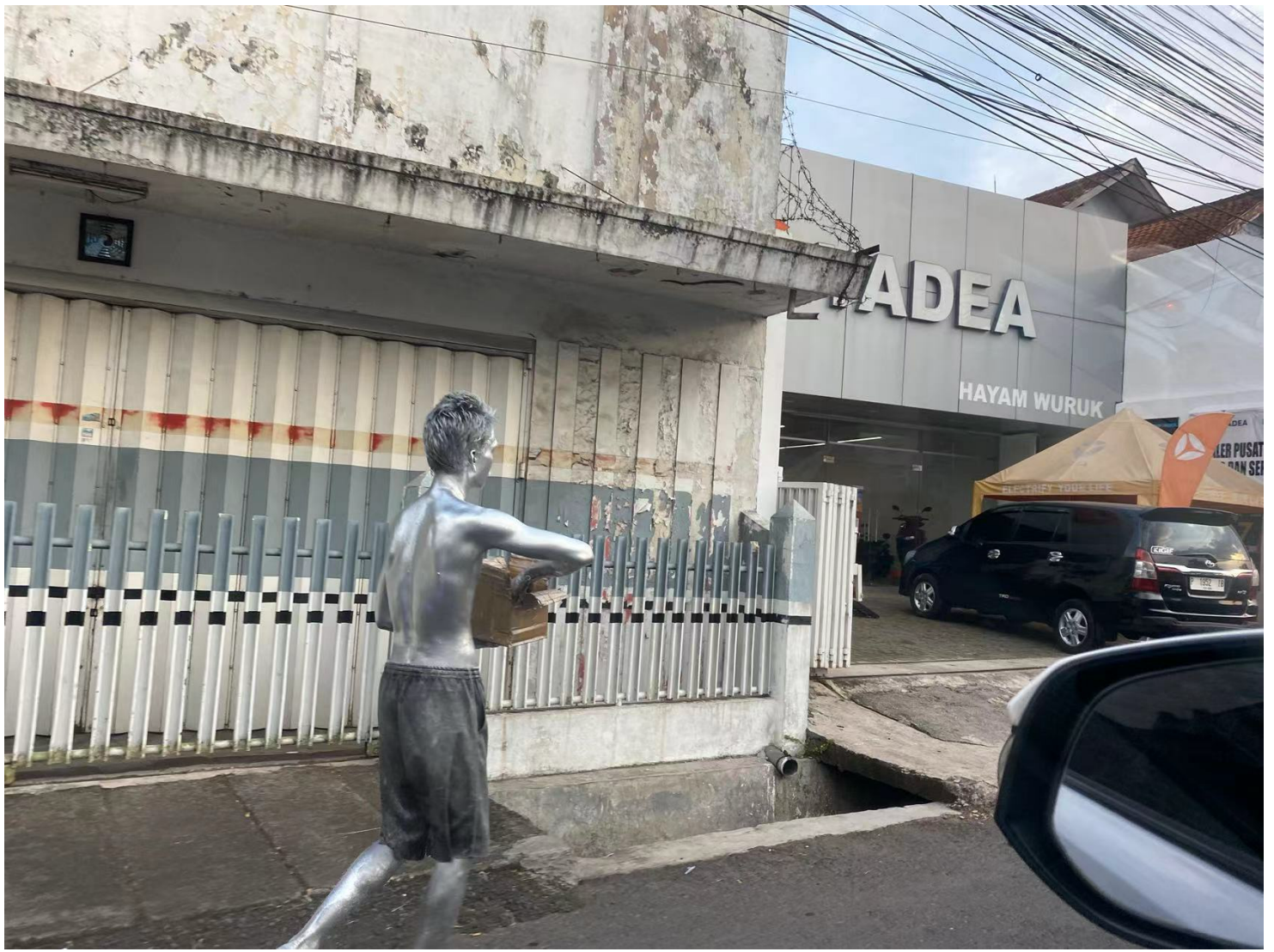
有时能见到银装素裹的乞讨者。